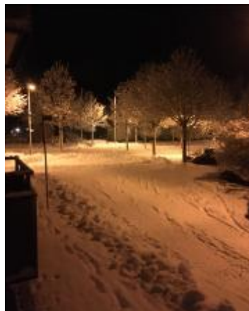
Vintervy från red bal- kong. Vackert så länge det varade.

Den ”Skånska vintern” slog till ordentligt under ett par dagar men nu är det mest töslask igen.