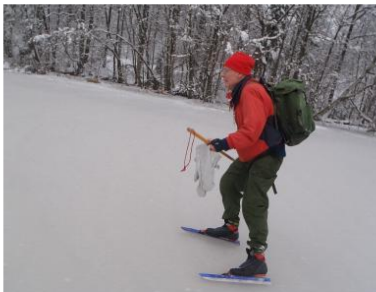
På vinglig färd i skenbar uppförsbacke!