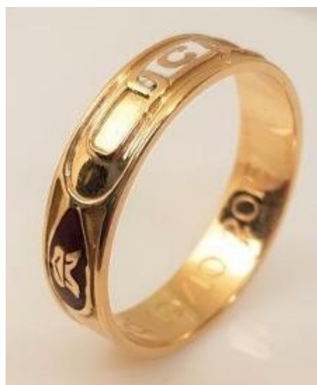
Odd Fellow-brödernas läger-ring. Erhålls när brodern får lägrets tredje grad, Kungspurpurgraden.

Seden att bära vigslingen på ringfingret kommer sig av att man under antiken allmänt ansåg att en ven, en blodåder, gick från ringfingret direkt till hjärtat.