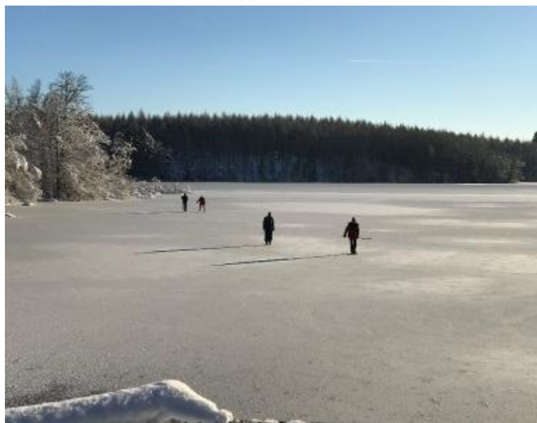
Håkantorps mölledamm, försiktighet rekommenderas!