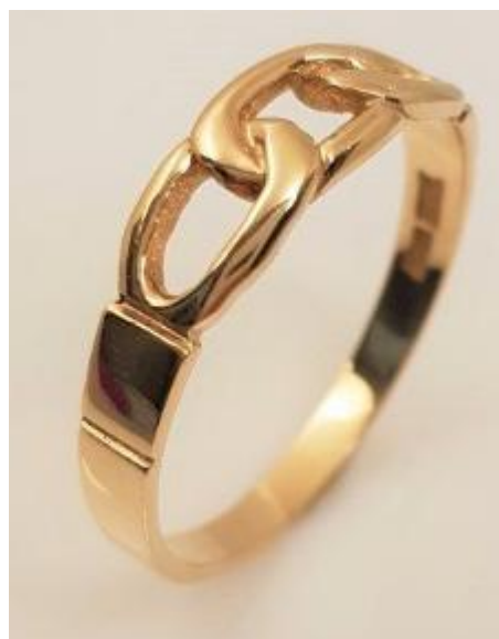
Rebeckaringen. Erhålls när systern får tredje logegraden.

Bearbetning av texter i "Talande tecken" gjord av red Göingebladet.