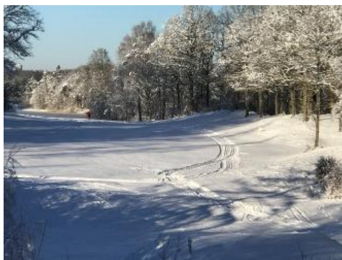
Perstorps golfbana där orienteringsklubben FK Boken på ett förtjänstfullt sätt lagt upp skidspår.