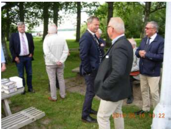
Så här såg det ut vid sommarmötet den 10 juni 2019. Grillning vid Finjasjön.