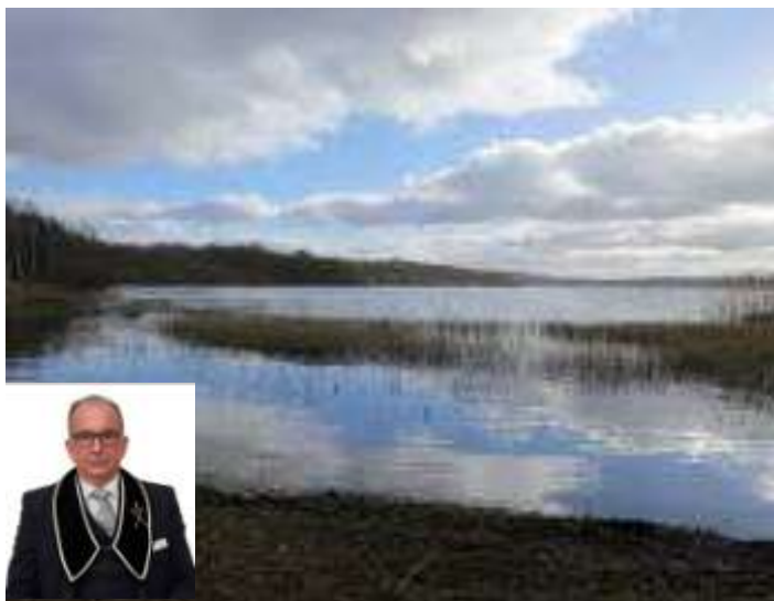
En besviken hamnkapten ser ut över en tom strand. Ingen Odd Fellow-grillning 2020!