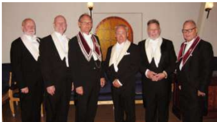
14 maj 2018.

Red bjuder i stället på foton från invigningsgraderna som genomfördes 2018-2019.