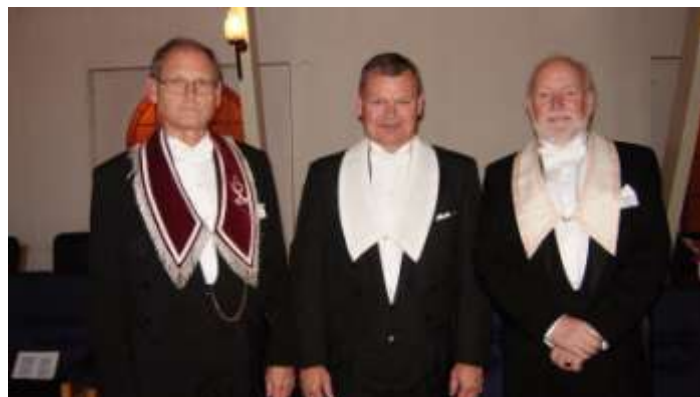
12 november 2018.