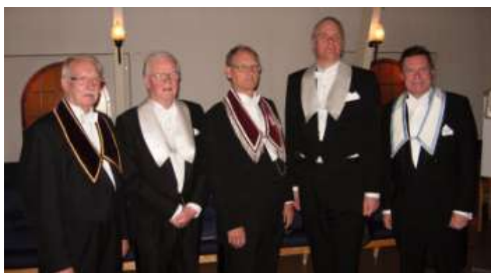
13 maj 2019.